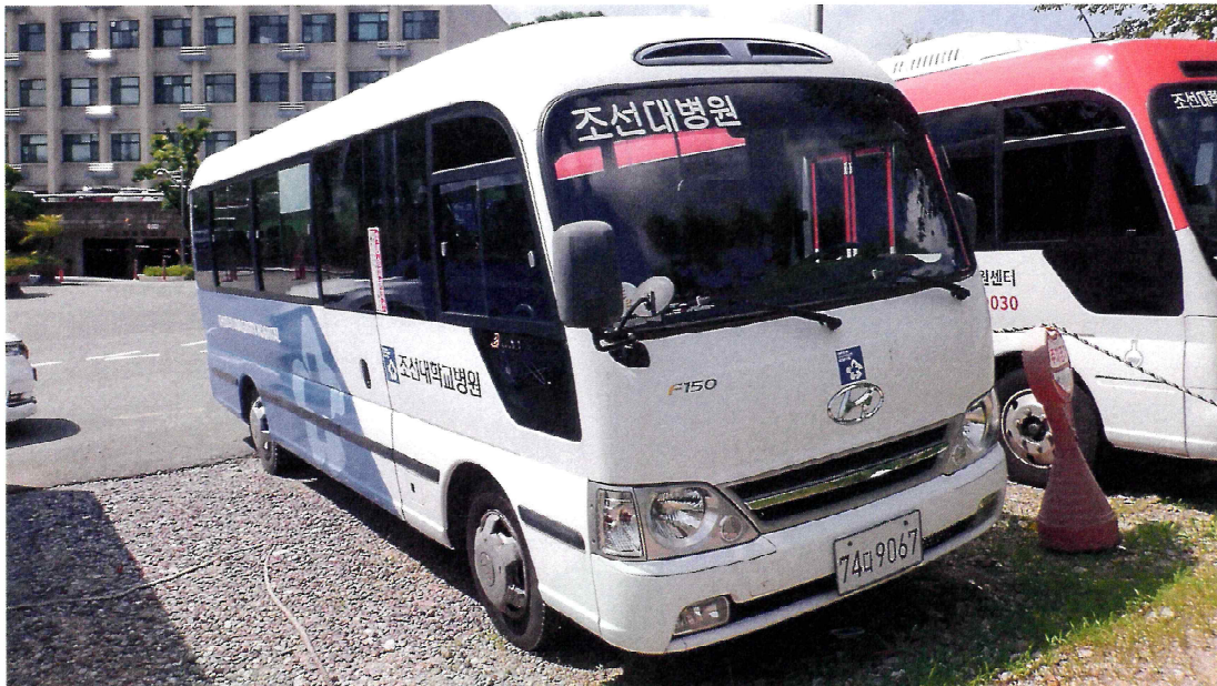
【 본건 전면 】