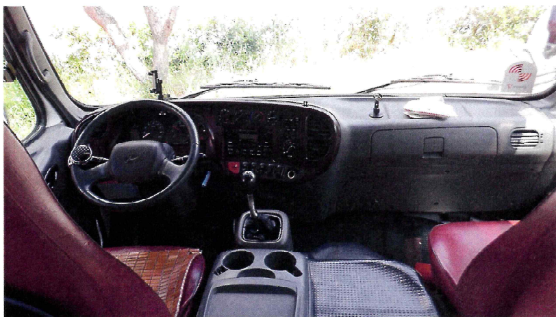
【 운전석 내부 】