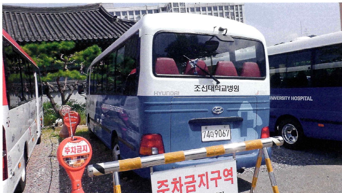
【 본건 후면 】